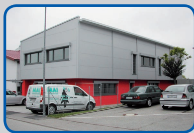
Umsetzung des Entwurfs

In partnerschaftlicher Zusammenarbeit entstandener Entwurf vom späteren Gewerbebau