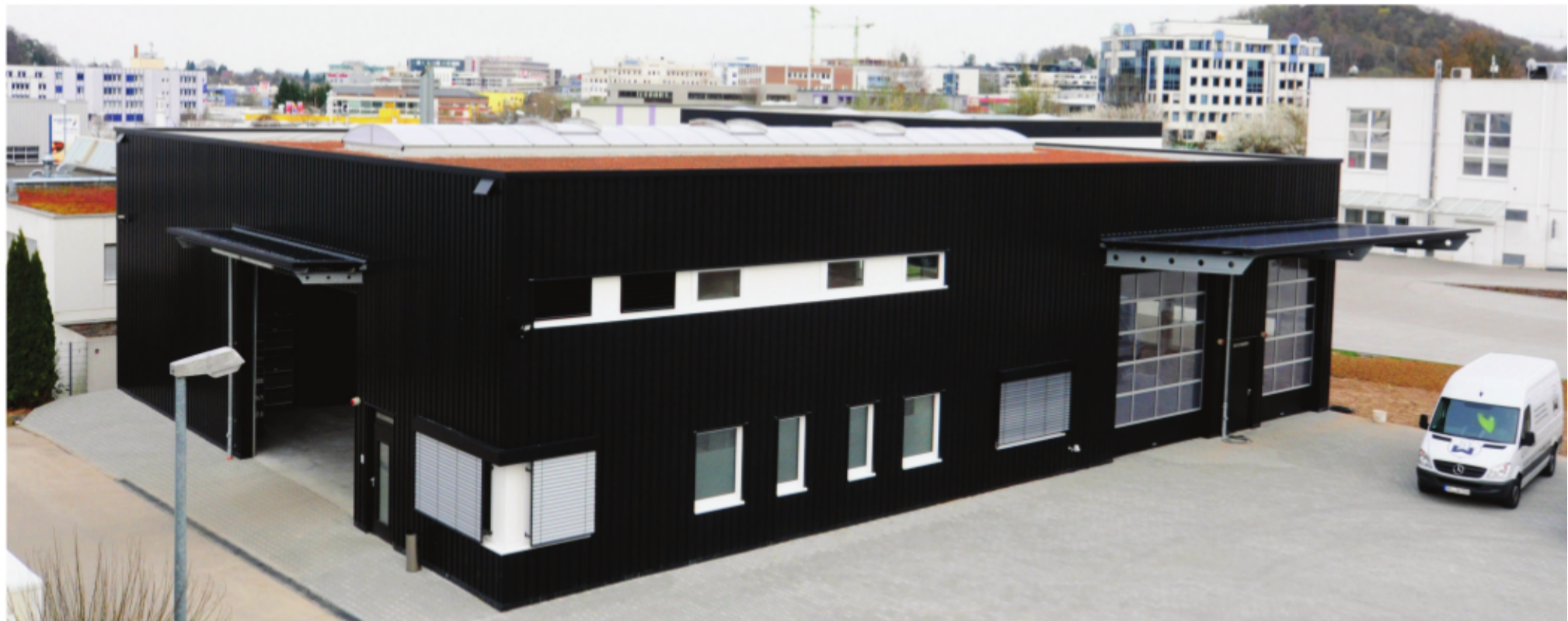
Eine klare Formensprache, welche die Architektur des Verwaltungsgebäudes aufnimmt.